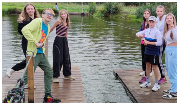
VORY MĚLY ÚSPĚCH. Žákům se líbilo vyžití na vorech.