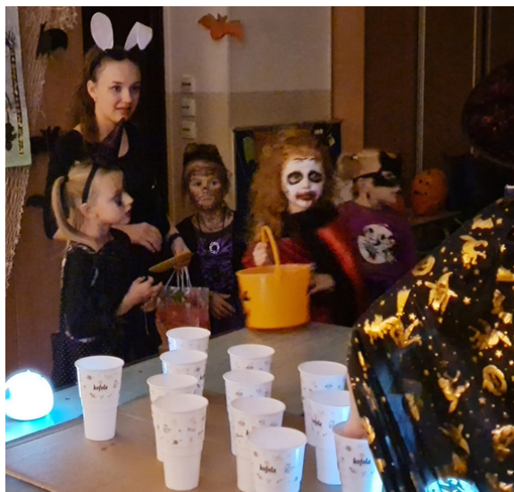
STANOVIŠTĚ KUŽELKY. Děti se snažily trefit se s míčkem odrazem od stolu do kelímku.

Příprava na halloweenskou procházku školou začíná na jaře vysazením dýní Jitkou Vyhlídkovou na její zahradě, a po prázdninách na prvních schůzkách vyučujících anglického jazyka. Tam se už domlouvá počet stanovišť.