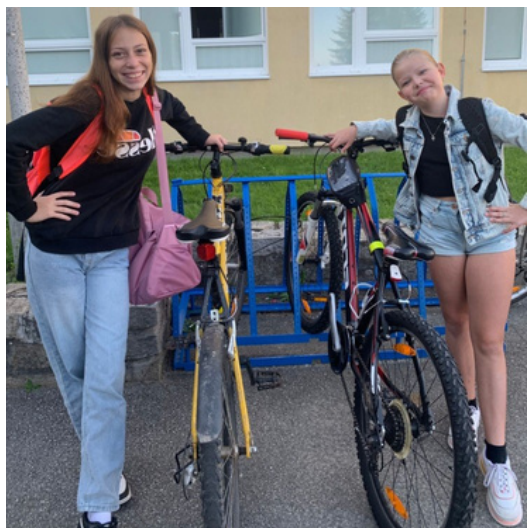
DO ŠKOLY NA KOLE. Počasí přálo, a tak byla ideální příležitost vytáhnout bicykly.

pět minut od školy. Také se mohly plnit dobrovolné aktivity například malovat obrázky, natáčet videa. „My jsme malovali obrázek se školou a škrtili jsme tam auto, protože jsme neměli jezdit autem ke škole,“ řekla žákyně 5. A.