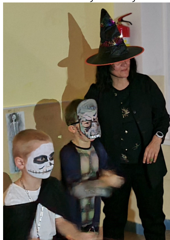
ZÁVODY NETOPYRŮ A PAVOUKŮ. Děti pohybem provázku posouvají pavouka do cíle.