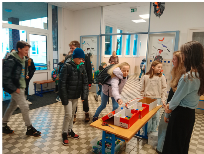
Foto: Během 20 minut hlasování skončilo v našich krabicích 270 hlasů.

V připravené krabici, která stála skoro dva týdny u šaten, se objevilo mnoho nápadů na názvy. Bylo těžké vybrat. Některé názvy se opakovaly, jiné nesouvisely s tématem. Ale nakonec s pomocí vedení školy byly vybrány tři nejlepší. Mezi nimi se objevily názvy: V BUBLINĚ, ZPRÁVY POD SLUNCEM A BUBLINKA. Ovšem ráno v den hlasování našly novinářky v krabici ještě několik dalších papírků, na nichž bylo napsáno PĚTKA, což jim trochu zamíchalo kartami. Bublinka s nižším počtem hlasů byla tím pádem vyřazena a nahrazena zmíněnou PĚTKOU. Kdo patří mezi ty, kteří s tímto nápadem přišli? Kdy tam papírky hodili?