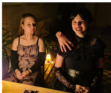
FANTASTICKÉ KOSTÝMY. Žáci i vyučující si dali se svými kostýmní práci. Byly opravdu povedené.