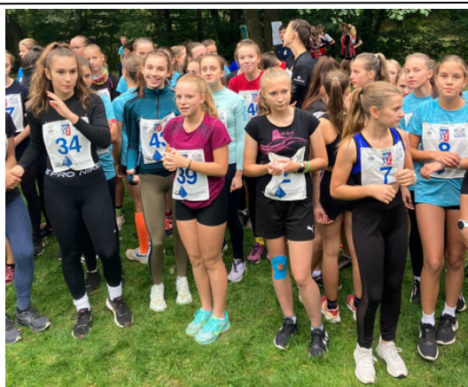
NAPĚTÍ PŘED STARTEM. Každá dívka dostala své číslo a poté již jen čekaly na odstartování závodu.