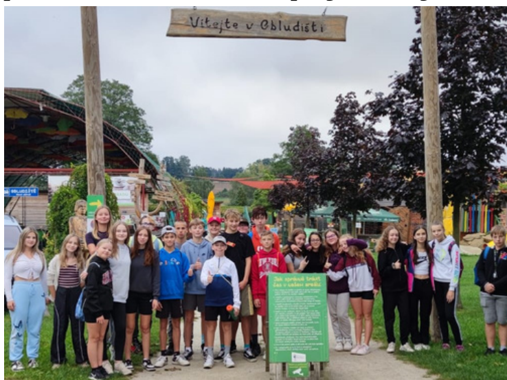
NAKONEC SE VŠICHNI SEŠLI. Z Obludiště našli všichni cestu ven.

Předposlední zářijový čtvrtek strávila 8. A v nedalekém Obludišti. Počasí jim přálo, a tak si užili den plný zábavy.