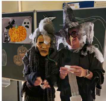
KOSTRA - MUMIE. Žáci si na tomto stanovišti obmotávali části těla toaletním papírem.

Na Dušičky zavítaly do naší školy nadpřirozené bytosti. Učitelé ve spolupráci se žáky zorganizovali totiž po čtyřleté pauze Halloween. Přípravy trvaly sice dlouho, zabraly mnoho času, ale podle účastníků to stálo za to. Školu ozařovaly vyřezané dýně, plamínky svíček a místo matematiky, přírodovědy a dalších předmětů se ve třídách vyučovalo obvazování mumií, poznávání nadpřirozených bytostí, lovení dýní nebo závody pavouků.