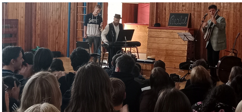
DOBROVOLNÍCI SE KUPODIVU HLÁSILI. Někteří žáci odhodili svůj stud a na vyzvání účinkujících šli za nimi, aby před svými spolužáky předvedli svůj hudební talent a nadšení.

„Poslechla jsem si představení pro menší a myslím si, že bylo moc pěkně zpracované,“ prozradila nám jako vyučující nejen hudební výchovy paní