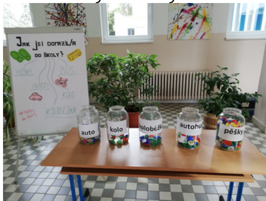
RANNÍ HLASOVÁNÍ. Děti po příchodu do školy házely víčka do sklenic podle toho, jak do školy dostaly.

Žáci třídy 6. B malovali plakáty s různými slogany jako třeba Mám rád ježky, proto chodím pěšky. „Také jsme natočili video, jak jdeme přes přechod, neseme naše plakáty, křičíme název Pěšky do školy a