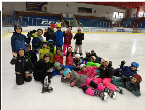
TŘÍDA 2. A PO SVÉM BRUSLAŘSKÉM VÝKONU.

„Hned na první lekci to žákům vůbec nešlo,“ svěřila se nám paní učitelka Mlčáková. „Ale po dvou hodinách už se některým žákům dařilo i bez pomoci,“ pokračovala paní učitelka.