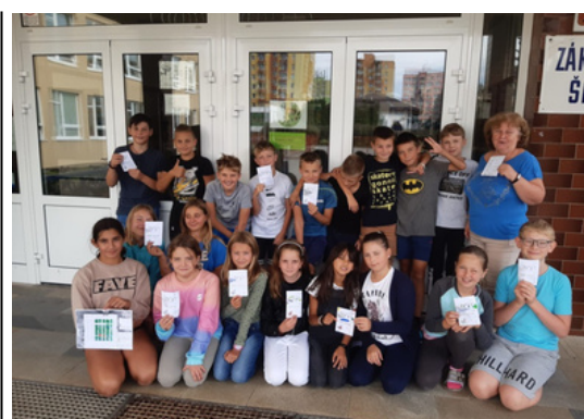
DALŠÍ AKTIVITY. Žáci i jejich učitelé přemýšleli nad tím, jak získat co nejvíce bodů, a tak tvořili plakáty, natáčeli videa. To přineslo své ovoce.

uši i tělo. Čas strávený chůzí do školy se dá využít k popovídání si se spolužáky, k zajímavému setkání nebo zažití něčeho neobvyklého. Z naší školy se do Pěšky do školy zapojilo celkem sedm týmů, těmi byly třídy 5. A, 6. A i 6. B, 7. B, 8. A, 9. A i 9. B. Dokonce se soutěže zúčastnili i samotní učitelé jako například paní učitelka Mrkvičková. Na konci září sledovali učitelé, jak se děti