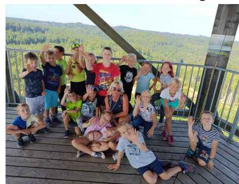
VÝHLED Z ROZHLEDNY. Žáci 2.A úspěšně vystoupali na rozhlednu, která zde stojí už od roku 2013.