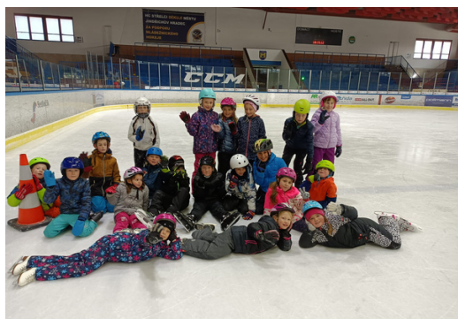
ŽÁČCI 2. B NA LEDĚ. Po sportu musí být čas také zapózovat fotografům.

Žáci druhých tříd se učí od poloviny října bruslit. Neodradí je ani odřená kolena. Na jindřichohradeckém stadionu Jana Marka by chtěli trávit více času.