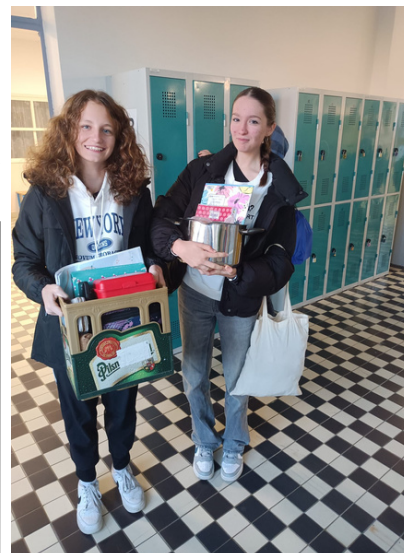
DO ŠKOLY S BASOU OD PIVA A HRNCEM PŘIŠLY DÍVKY Z 9.A. Doma vzaly věci, které využily poněkud neobvykle. V hrnci se místo kusu masa objevily učebnice a sešity.

„Vojta se nejspíše inspiroval na jindřichohradeckém gymnáziu,“ řekl pan učitel Nedělka. No Backpack Day se týkal pouze 6. až 9. tříd. Členové školního parlamentu se na konání akce shodli. Jediným oříškem pro ně prý byla tvorba plakátu. Bylo zajímavé pozorovat, s čím děti do školy chodily. Některé byly opravdu originální a batoh rády vyměnily za cestovní kufry, dětské kočárky, krabice, šuplíky, boxy nebo třeba fusaky na pruty, boby a dětskou tatrovku. „Já jsem přišla s kočíčím pelechem, přišlo mi to originální,“ řekla žákyně 6.B. Vyměnit batohy za různé originality mohli nejen žáci, ale i učitelé. Zapojil se například pan učitel Nedělka, který si