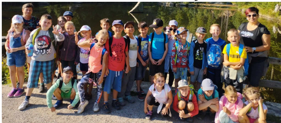
ĎÁBLOVA PRDEL BYL OPRAVDU ZÁŽITEK. Děti 2.B se musely u tohoto útvaru vyfotit, aby se mohly pochlubit i doma.

Valtínov/ Paní učitelka Mlčáková a paní učitelka Pragerová se rozhodly, že pojedou s dětmi na výlet na rozhlednu U Jakuba.