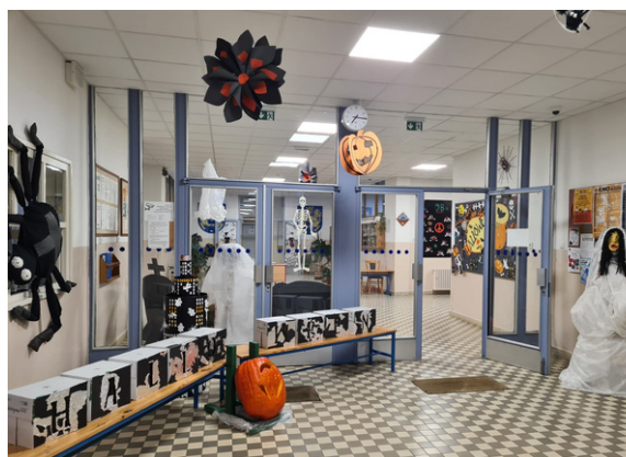
VESTIBUL PLNÝ PAVOUKŮ A DÝNÍ.

„Hodně jsem se bál,“ svěřil se nám prvňáček. „Ale i tak se mi to velmi líbilo a rád bych si to zopakoval,“ pokračoval. Nejvíce se děti bály klauna, který prý byl velmi strašidelný. „Mně se tam vůbec nechtělo jít,“ řekl žák z 3.B. „Ale i tak jsem tam šel a málem jsem se rozbrečel,“ pokračoval vystrašeně hoch.