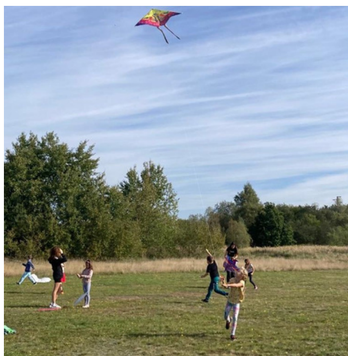
LÉTALI NEJEN DRACI. Na vojenském cvičišti běhaly radostné děti. Každý se snažil, aby jeho drak byl co nejvýše.