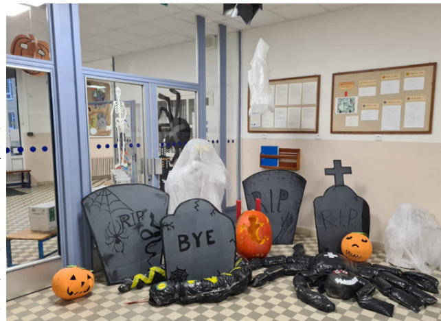
VÝZDOBA NAŠÍ ŠKOLY ZÍSKÁVÁ PLNÝ POČET BODŮ.

Lidí zde bylo hodně, ale všichni žáci se nezúčastnili. Akce byla připravena jenom pro žáky prvních až pátých tříd. Na chodbě však byli k vidění i osmáci a devátáci, kteří učitelům pomáhali. Devátáci se chopili malých prvňáčků. Sice se trochu báli, ale za žádných okolností se nevzdali.