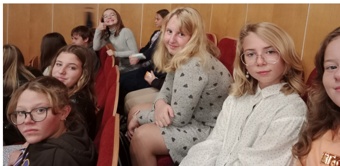
DO DIVADLA V JINÉM OBLEČENÍ NEŽ DO ŠKOLY. Někteří žáci si u příležitosti návštěvy divadla oblékli jiné ošacení, než ve kterém chodí běžně do školy. Dívky si vzaly šaty, košile, sukně, někteří chlapci i košile a společenské kalhoty.

Příběh, ve kterém se hledala spravedlnost, pravda a právo, měl spád. Pro žáky byl srozumitelný.