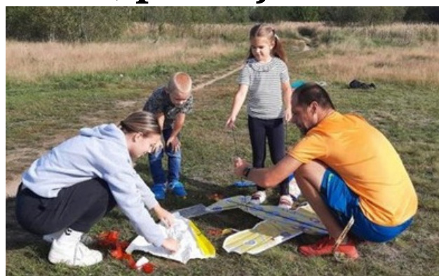
NEJDŘÍVE MONTÁŽ. Než nebe zaplavili draci, bylo nutné je sestavit.

V zářijových dnech jste nad Hradcem mohli vidět draky. Nejedná se však o bájně bestie, ale o papírové draky!